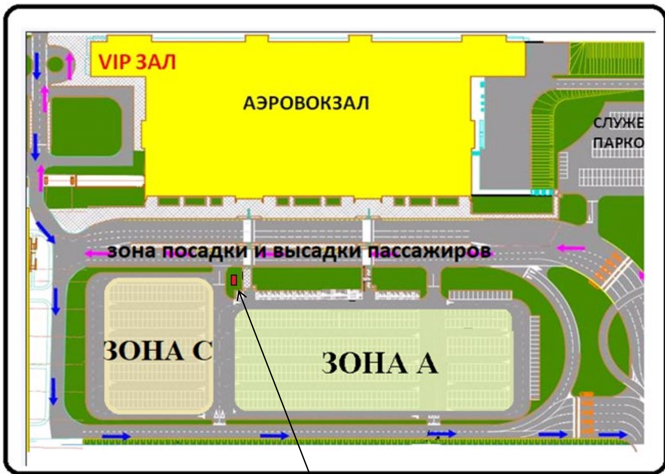
СХЕМА расположения Площади, арендуемой на привокзальной площади АВК